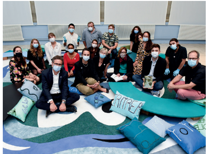
Commissaires et membres des équipes de Rumine réunis lors du vernissage de l'exposition Exotic ?