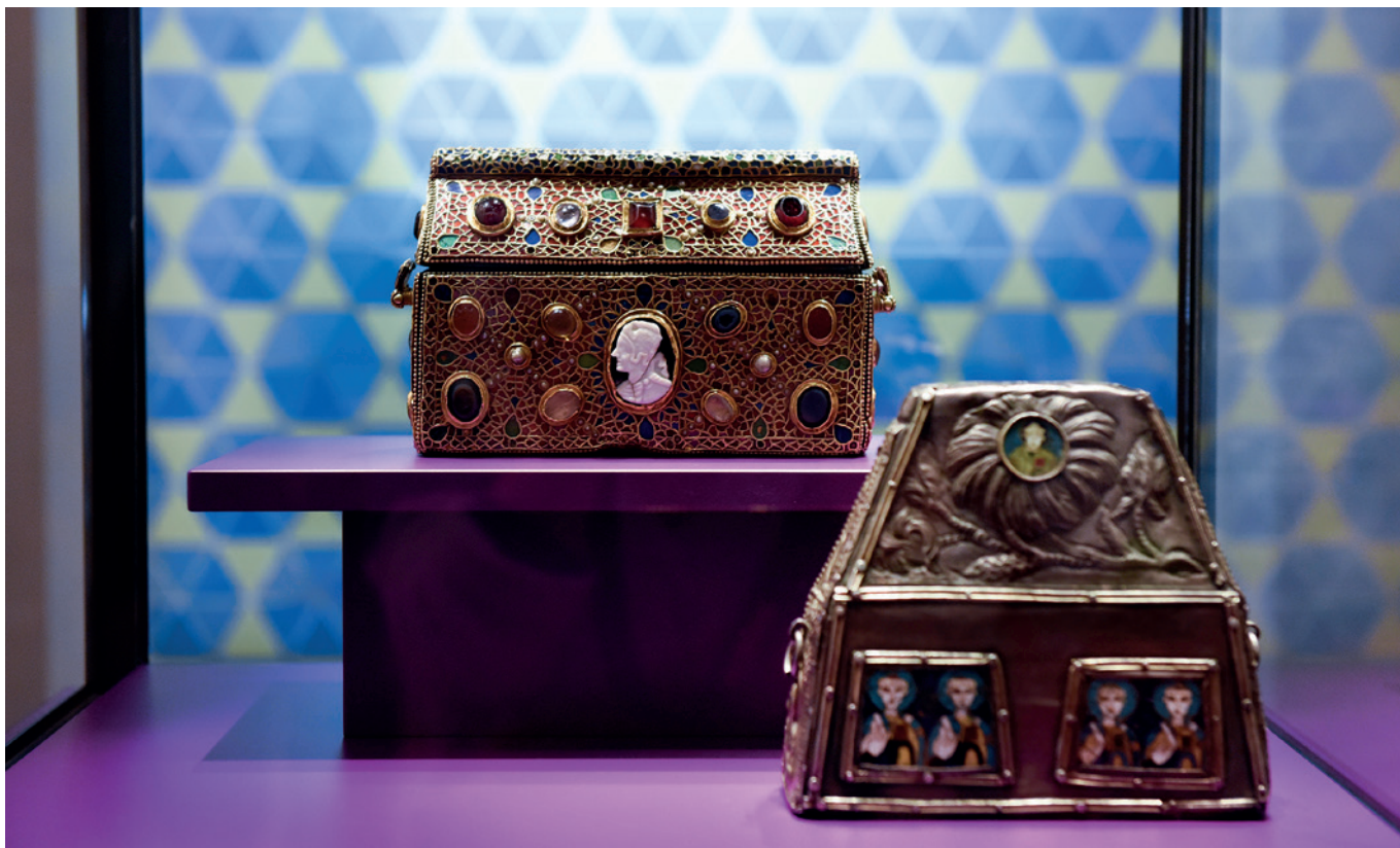
En haut : Coffret-reliquaire de Teudéric, première moitié du 7 e siècle. Trésor de l'Abbaye de Saint-Maurice (VS). En bas : Coffret-reliquaire en plaques d'argent, partiellement dorées, fin du 8 e siècle. Trésor du Chapitre cathédral de Sion (VS).