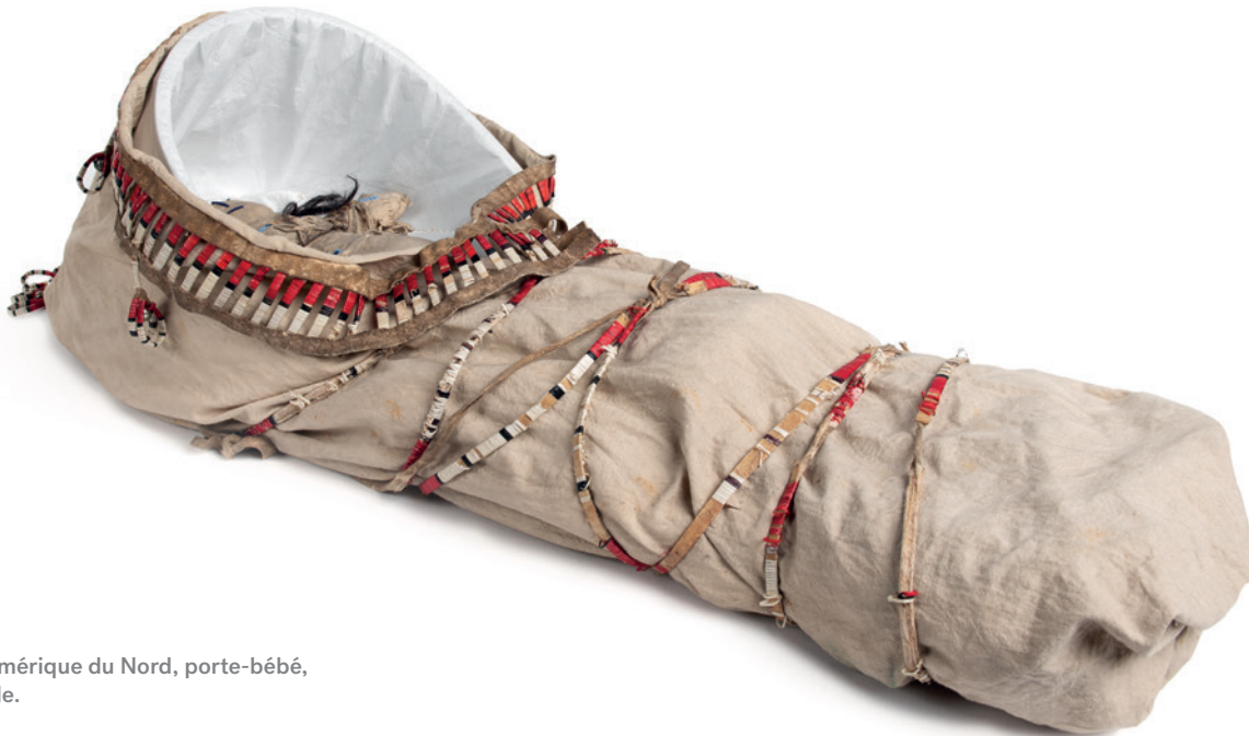
Collection Amérique du Nord, porte-bébé, 19 e -20 e siècle.

L'inventaire et l'étude des acquisitions de 2019 de la collection du valet de chambre vaudois de Napoléon 1 er , Jean-Abram Noverraz, ont été réalisés. De plus, un travail de recherche a été mené sur l'histoire des souvenirs napoléoniens entrés depuis le 19 e siècle dans les collections du MCAH. Une publication aux éditions Cabédita sur Noverraz est prévue pour le printemps 2021, à l'occasion du 200 e anniversaire de la mort de l'Empereur.