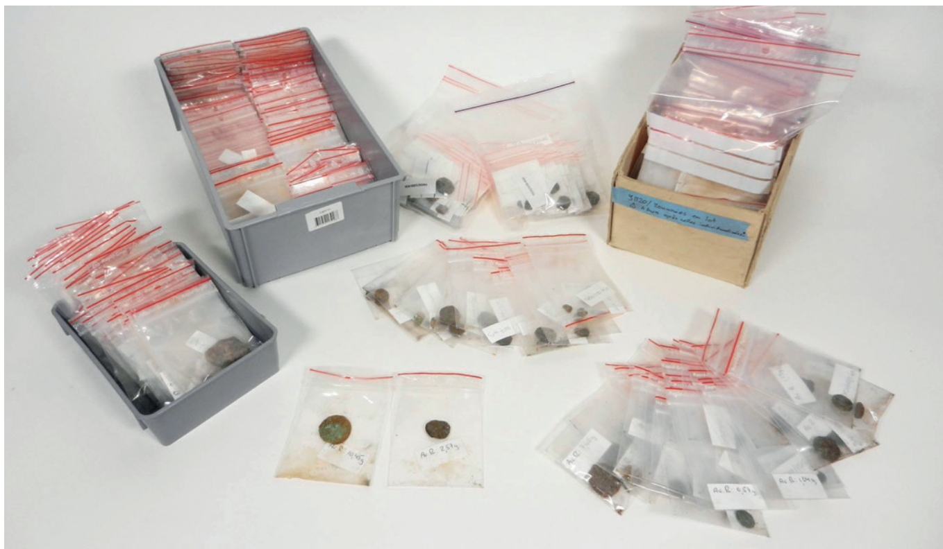
Lot de monnaies d'Yverdon Midi 35 à restaurer, enregistrer et identifier.