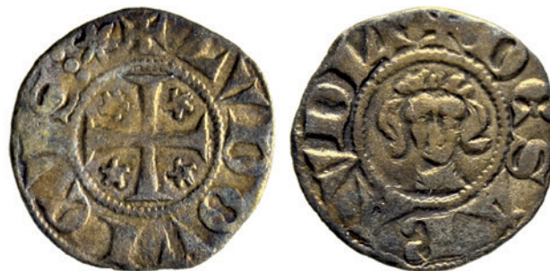
Denier viennois émis par Louis II de Savoie, baron de Vaud de 1302 à 1349.

Durant le printemps, plusieurs séances préparatoires à l'élaboration d'un cahier des charges d'un nouveau programme de gestion des collections ont eu lieu en visio-conférence. Ces séances réunissaient une personne en charge du projet pour chaque musée concerné. Ce projet de migration des données d'inventaire concerne le MCAH et le Musée romain d'Avenches d'une part, le Musée cantonal des Beaux-Arts, le Musée de l'Élysée et le MUDAC d'autre part, le tout sous la tutelle de la DGNSI (Direction générale du numérique et des systèmes d'information) qui pilote le projet et accompagne les musées. Bien que les séances préparatoires aient eu lieu en commun, deux cahiers des charges spécifiques ont été développés en fonction des spécificités des musées. Le cahier des charges pour le MCAH et le MRA ont été validés en fin d'année 2020 par les deux institutions et un appel d'offre sera lancé au printemps 2021. La mise en place de la nouvelle application et la migration des données devraient être réalisées fin 2021 et début 2022. Cette migration des données depuis l'application