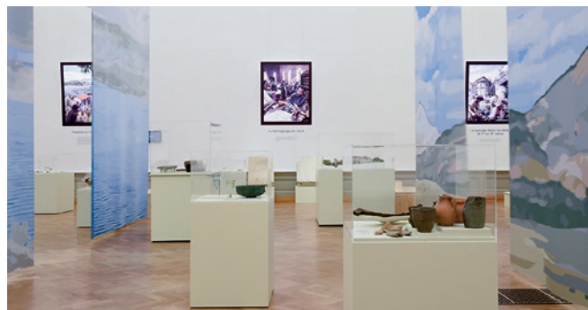
Vue de l'exposition dans les grandes salles du Palais de Rumine.

L'exposition temporaire Aux sources du Moyen Âge , coproduite par le Musée cantonal d'histoire du Valais et le MCAH, pour laquelle le catalogue du même nom avait été publié en 2019 (voir Rapport d'activité 2019, p. 36), a été vernie le 6 février 2020. Elle dévoilait la petite et la grande histoire de la période qui s'étend de la fin de l'Antiquité à l'an 1000. Les visiteurs pouvaient découvrir la richesse et la diversité des vestiges du Haut Moyen Âge conservés dans la région qui couvre les actuels cantons du Valais, de Vaud et de Genève, ainsi qu'une partie de ceux de Fribourg, de Neuchâtel et du Jura.