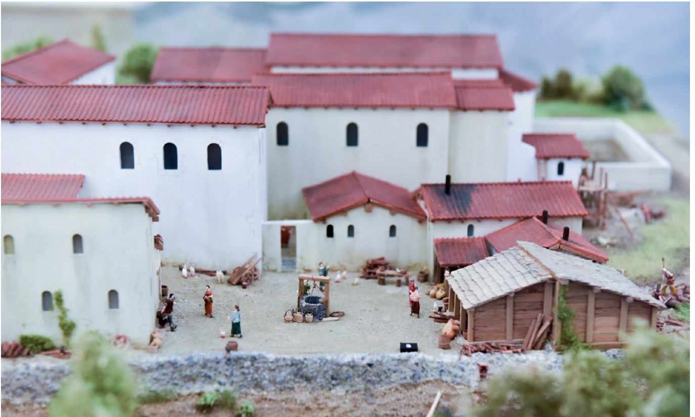
Maquette de l'Abbatiale de Romainmôtier vers 700 ap. J.-C. (Hugo Lienhard)

En raison du Covid-19, elle a dû malheureusement fermer ses portes le 15 mars, mais une visite guidée virtuelle a été mise en ligne dix jours plus tard afin de ne pas priver le public de ses merveilles. Présentée par le directeur du MCAH dans l'émission forum de la RTS, la visite a eu un grand succès avec près de 3000 visiteurs dans les deux mois de fermeture du printemps. Le lien est toujours actif en ligne depuis le site internet du MCAH. Une interview pour l'émission Hautes fréquences sur RTS-Religion intitulée « sacré Haut Moyen Âge » a permis d'expliquer au public l'histoire du christianisme dans nos régions et notamment l'histoire monétaire de cette période (31 mai). De petits films avec interviews, réalisés par Adrien Bürki, sur diverses thématiques et objets de l'exposition, y