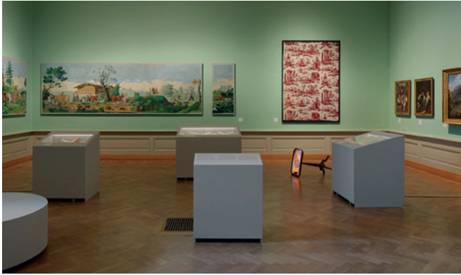
Vue de la salle Les Sauvages des Alpes .