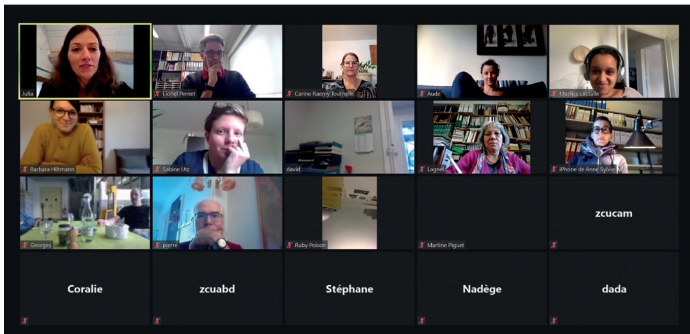
Emblématiques de l'année 2020 : les réunions d'équipe en visioconférence.

à toutefois créé une forme de lassitude en novembre. Nous l'avons constaté avec la fréquentation moins assidue de la visite virtuelle de l'exposition Exotic? (près de 1000 visites sur deux mois) que celle de Aux sources du Moyen Âge (3000 visites lors du premier confinement). Numériser une exposition et la mettre en ligne ne suffit pas, il faudra réfléchir à des manières d'enrichir les expériences vécues en ligne pour les rendre différentes de celles qu'on vit dans les salles. Dans le monde d'après, le numérique précède ou prolonge la venue au Musée, mais ne la remplace en aucun cas. En 2020, faute de mieux, le numérique a servi de rustine ; grande est donc la marge d'amélioration !