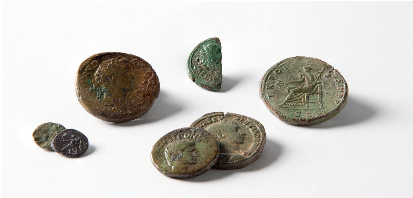
Monnaies romaines de Lausanne-Vidy présentées dans Collections Printemps 2020 .