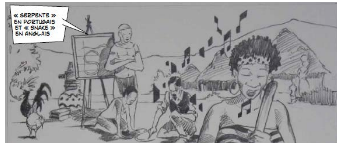
Dessin de S. Boroni, BD Capitão

et en 2020 au MEN à Neuchâtel. La singularité et l'originalité de ce projet initié par l'Association Lemana est de s'appuyer également sur la bande dessinée Capitão pour présenter des connaissances historiques récentes autour de l'importance des missions romandes en Afrique australe.