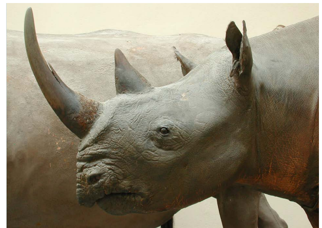
Rhinocéros du musée