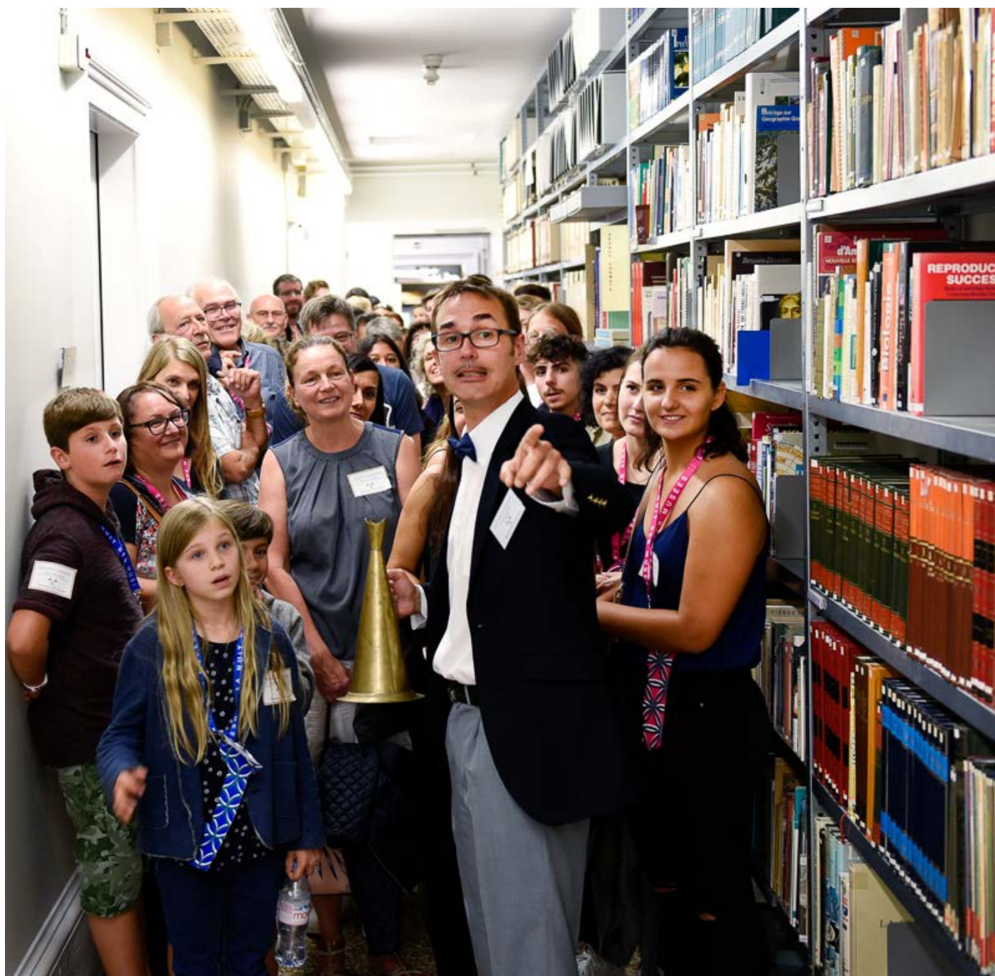
Nuit des Musées 2018, exposition COSMOS Vente aux enchères du Palais de Rumine

En 2019, le Musée cantonal des Beaux-Arts prépare son déménagement et utilisera les salles d'exposition pour conditionner ses œuvres. Les musées de sciences et d'histoire déploieront leurs expositions temporaires dans d'autres espaces, dont vous trouverez un aperçu ci-dessous; et dans l'idée de préfigurer un Palais de Rumine 3.0, nous accueillerons du 8 au 10 novembre MUSEOMIX , une rencontre-marathon de trois jours réunissant des passionnés d'horizons divers pour imaginer des prototypes de médiation culturelle utilisant les nouvelles technologies.