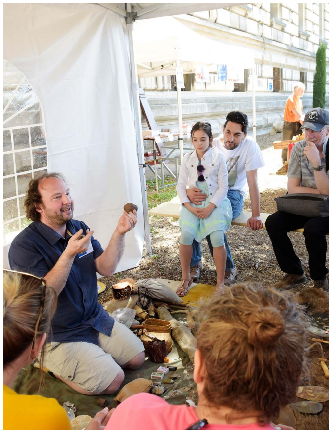
Journées vaudoises d'archéologie 2018