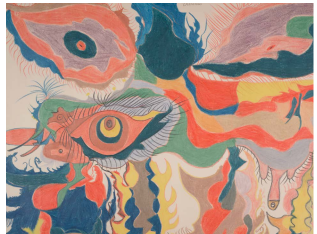
Gaston Duf / Rinâûsêrôshe/ viltritiês , 1950