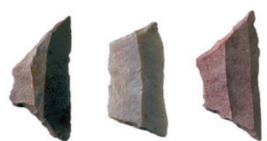
microlithes, pointes en silex