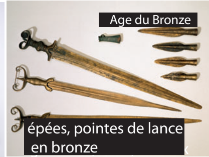
épées, pointes de lance en bronze