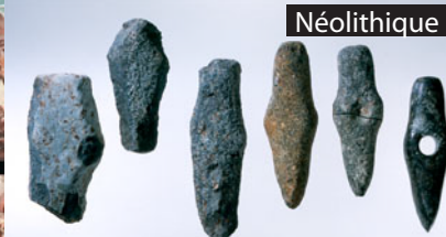
les étapes de fabrication d'une lame de hache polie