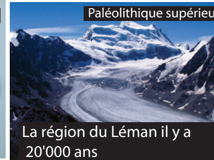
La région du Léman il y a 20'000 ans