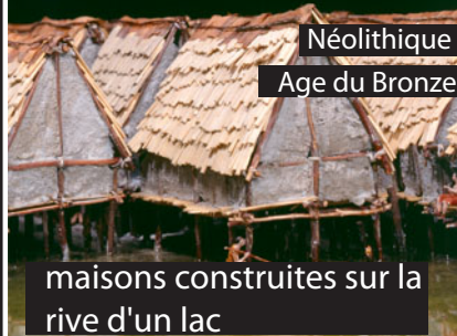
maisons construites sur la rive d'un lac