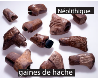
gaines de hache