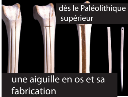
une aiguille en os et sa fabrication