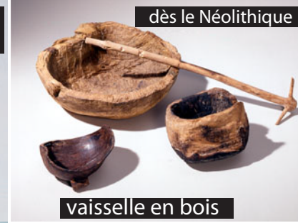
vaisselle en bois