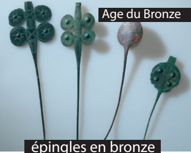
épingles en bronze