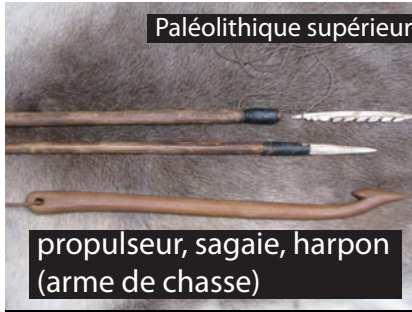
propulseur, sagaie, harpon (arme de chasse)