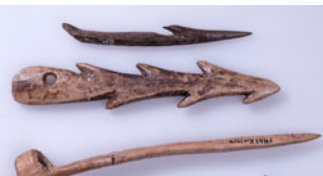
instruments de pêche en bois de cerf