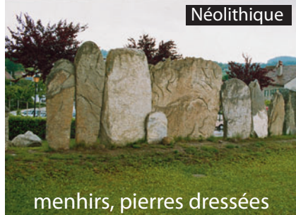
menhirs, pierres dressées