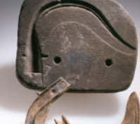
invention de la métallurgie