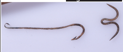
hameçon en bronze