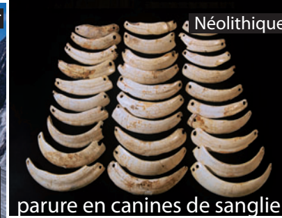
parure en canines de sanglier