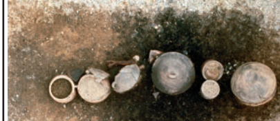
tombe à incinération, le mort est brûlé