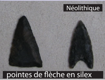
pointes de flèche en silex