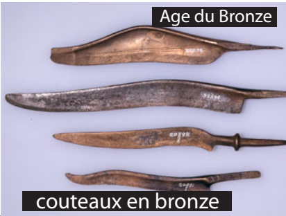
couteaux en bronze