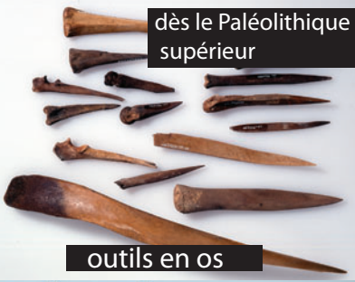
outils en os