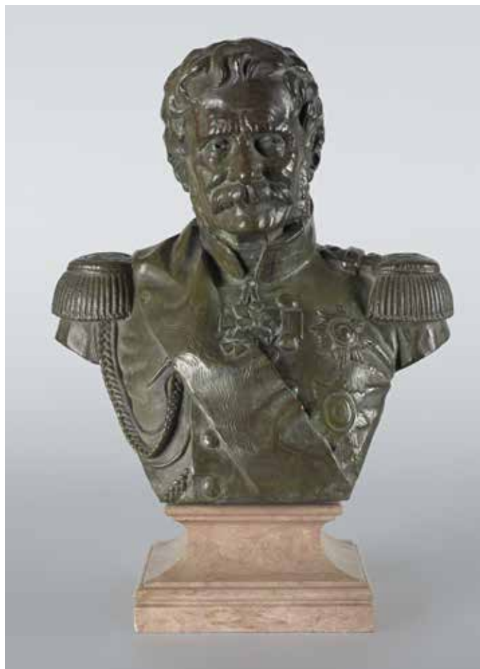
R. Lugeon. Buste du général Antoine-Henri de Jomini, bronze, 1907.

Le sculpteur vaudois Raphaël Lugeon est la véritable cheville ouvrière de la reconstitution du portail Montfalcon réalisée entre 1889 et 1909. Héritier spirituel de Viollet-le-Duc, qui fut un intime de la famille, Lugeon acquiert grâce à cette intervention magistrale une renommée artistique considérable, qui stimule son intense activité créatrice. Outre son engagement à la cathédrale de Lausanne qui l'occupe plus de deux décennies, Lugeon contribue à quelques restaurations d'édifices médiévaux exemplaires de la région. Multipliant les expositions de sociétés d'artistes, il fait également œuvre de créateur et participe à l'affermissement d'un académisme artistique vaudois. Enseignant dans les grandes écoles d'art cantonales, Lugeon ne cessera de dédier son talent de sculpteur à la célébration des grandes figures du pays de Vaud.