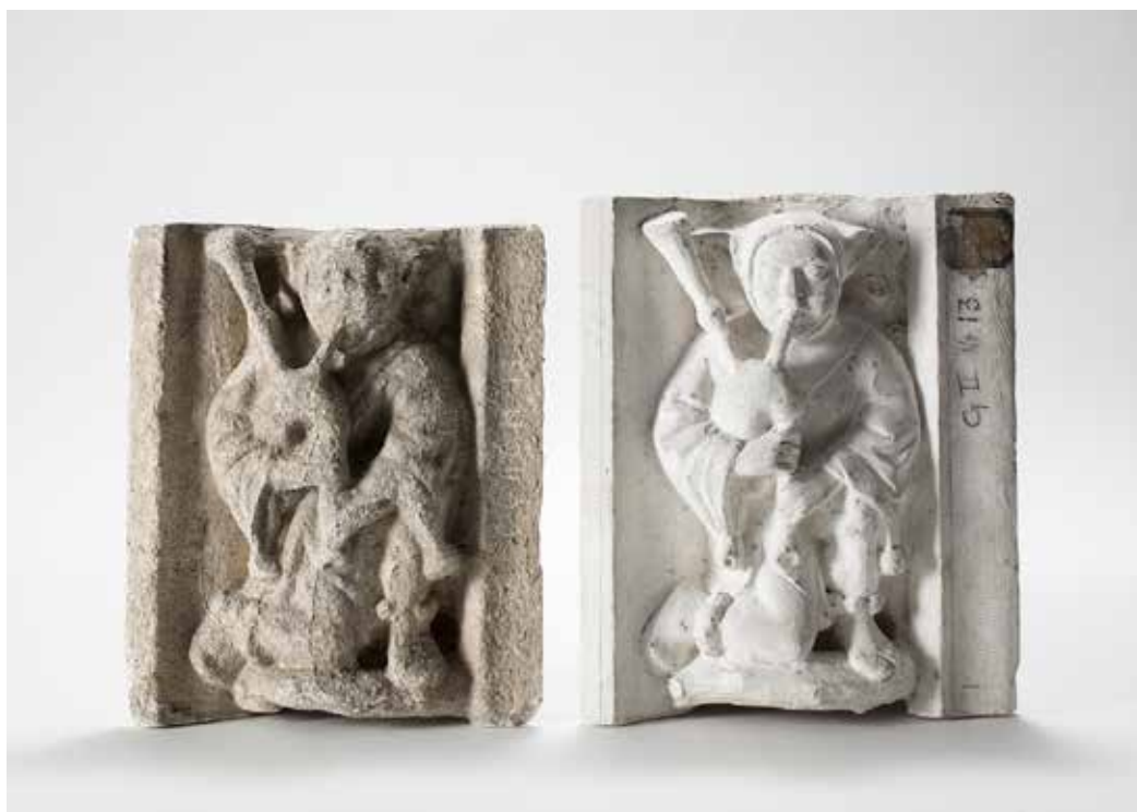
Fou jouant de la cornemuse, frise, copie et reconstitution, plâtre, 1892.