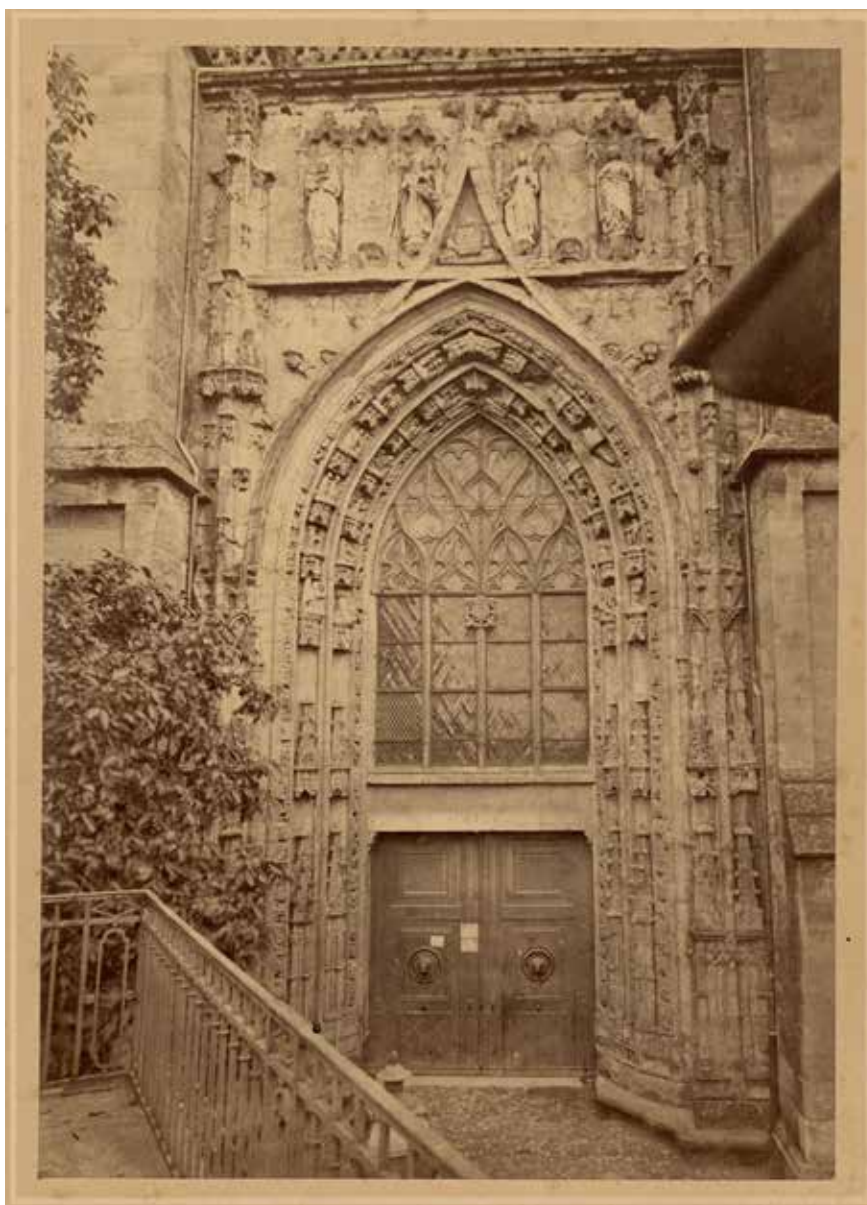
Le portail avant travaux, état vers 1875.