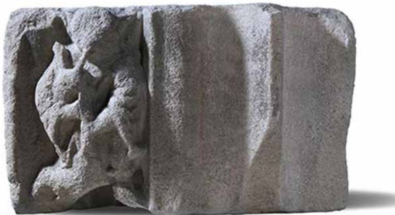
Fou jouant de la cornemuse, frise, grès, 1515-1536.