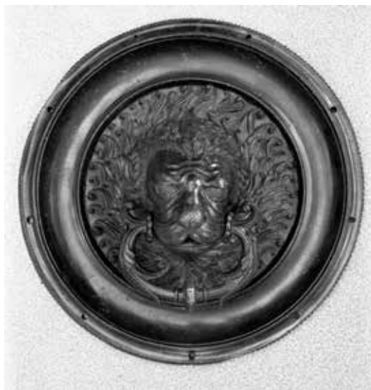
Applique en forme de muse de lion, bronze, 1225-1235 (lion) - 17 e siècle [?](cadre). Attestée dans le portail occidental dès le 17 e siècle, déposée pour des raisons de conservation; depuis août 2017, remplacée in situ par une copie.

Laissé inachevé à la Réforme, le portail subsiste en l'état jusqu'au milieu du 18 e siècle, malgré des signes évidents de dégradation constatés plus d'un siècle auparavant. Il est toutefois équipé en 1602-1603 de nouvelles portes en sapin noirci. Ornées de ferrures peintes en rouge, accueillant deux appliques en bronze composées chacune d'une tête de lion en haut relief tenant un anneau dans la gueule et d'un encadrement mouluré. Entre 1768 et 1774, lors d'une vaste campagne de travaux ordonnée par les autorités bernoises, le portail est réparé et complété dans ses parties basses, vides depuis 1536, par des pyramidions d'inspiration gothique. S'il retient l'attention des érudits dès le début du 19 e siècle, il faudra attendre l'arrivée de Viollet-le-Duc à Lausanne en 1872 pour envisager sa réfection.