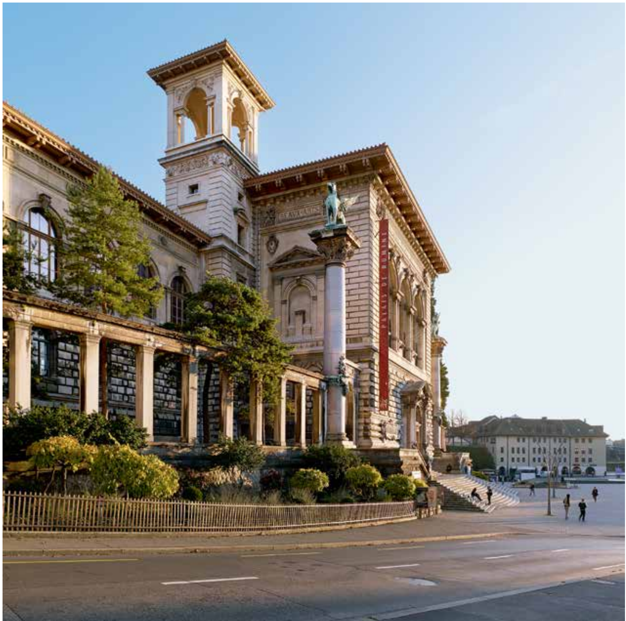
Palais de Rumine.

La fréquentation totale du Musée est en augmentation, 16000 visiteurs en 2015, 20000 en 2016.