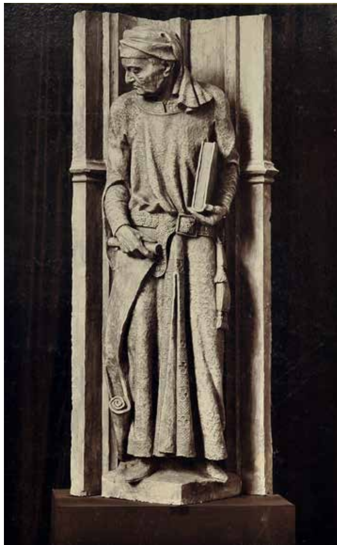
Ezéchiël, statue des piédroits, modèle, plâtre, 1903-1904.