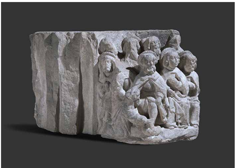
Lavement des pieds, voussure, grès, 1515-1536.