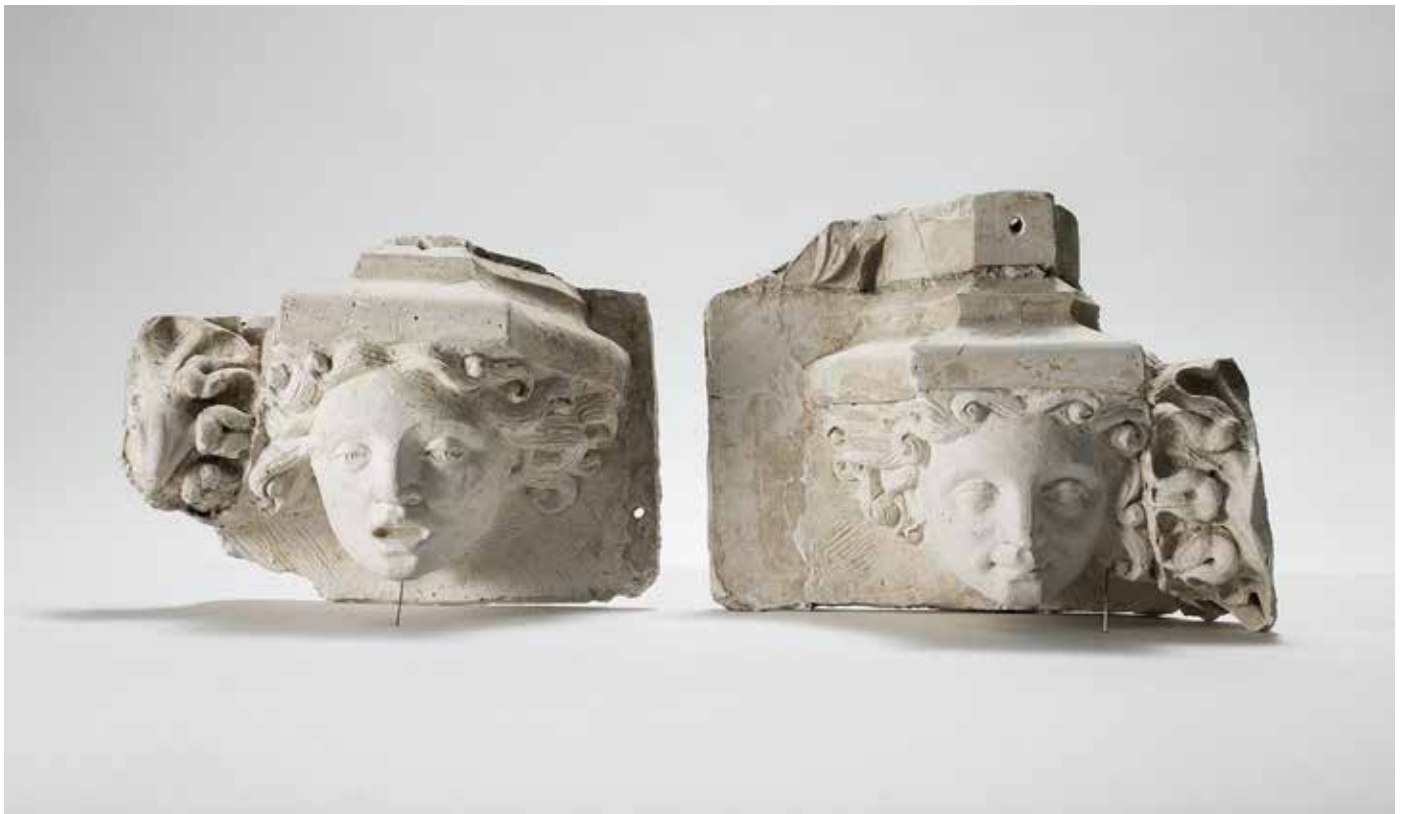
Putti, consoles, modèle, plâtre, 1898-1899.