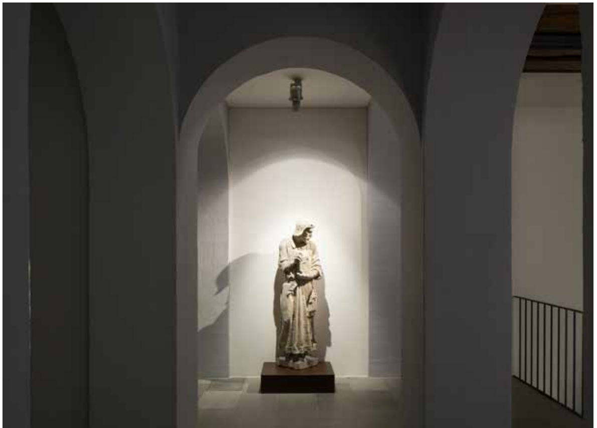
Vues de l'exposition

Musée cantonal d'archéologie et d'histoire Palais de Rumine Place de la Riponne 6 1005 Lausanne