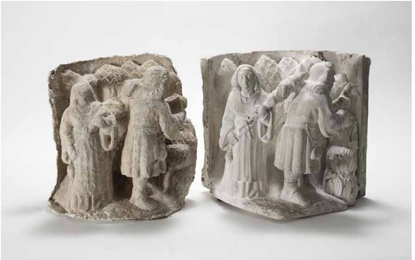
Adam et Eve au travail, voussure, copie et reconstitution, plâtre, 1896-1898.